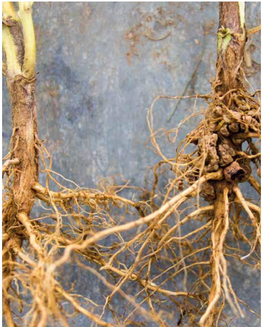
Sojabohne ohne Impfung

Das Produkt ist sofort verwendbar, ein vorheriges Mischen von Einzelkomponenten ist nicht erforderlich. Nur ein sorgfältiges Durchmischen des Saatguts ist nötig, um sicherzustellen, dass alle Samenkörner mit dem Impfmittel in Berührung kommen. Wir empfehlen die Impfung direkt in der Drillmaschine oder in einem dafür geeigneten Betonmischer o. ä.. Um das Impfmittel fein verteilen zu können, ist ein Pumpzerstäuber oder eine Feldspritze eine gute Wahl.