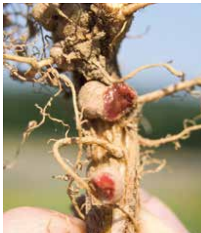
Wurzel einer mit RhizoFix® geimpften Sojabohne

Leguminosen gehen mit artenspezifischen Rhizobien (Knöllchenbakterien) eine Symbiose ein. Über die Knöllchen sind die Leguminosen in der Lage, Luftstickstoff zu fixieren. Deshalb können auch nur Leguminosen mit einem ausreichenden Knöllchenbesatz ihre optimale Leistung erreichen. Luftstickstoff stellt mit einem Anteil von 78 % an der Luft ein großes Stickstoffreservoir dar. Allerdings können die meisten Pflanzen Stickstoff nur in mineralischer Form als Ammonium und vor allem Nitrat aufnehmen. Nur Leguminosen können in Symbiose mit Rhizobien den molekularen Luftstickstoff fixieren. Um diese Symbiose zu gewährleisten, ist ein Kontakt zwischen der Wurzel und den Bakterien erforderlich. Um die Rhizobien zu den Wurzeln zu locken, scheiden diese Stoffe aus, welche die Rhizobien zu den Pflanzen führen. Über diese Stoffe erkennen die Bakterien die Pflanzenzellen und es findet eine „Infektion“ der Wurzelzelle statt. Um eine ausreichende