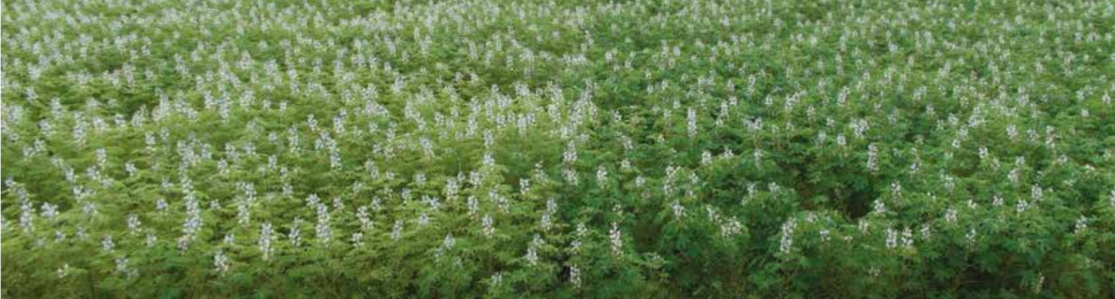
Weißer Lupinen ohne Impfung