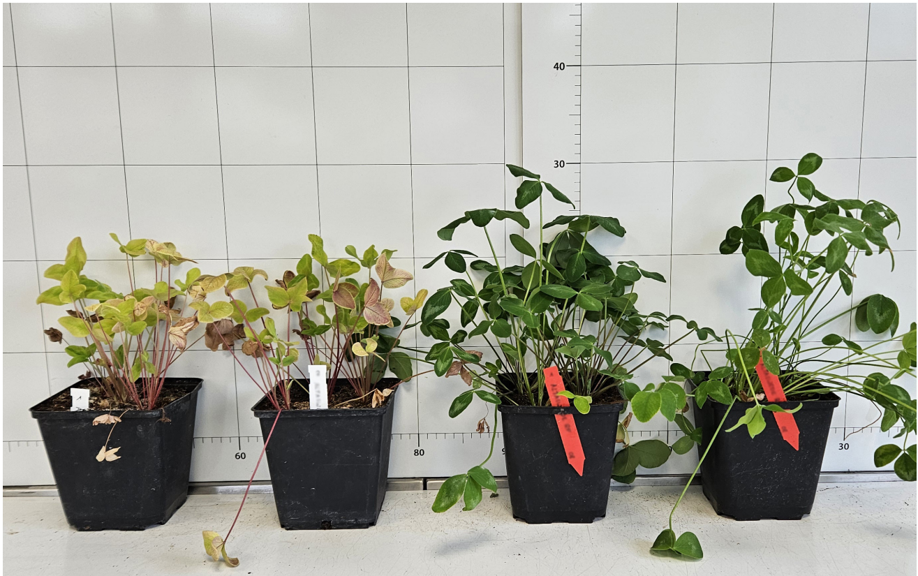
Links: Rotklee ohne Impfung / Rechts: Rotklee geimpft mit RhizoFix® und deutlicher Grünfärbung

Fragen zu RhizoFix®, Rhizobien oder Saatgutimpfung? Rufen Sie an!