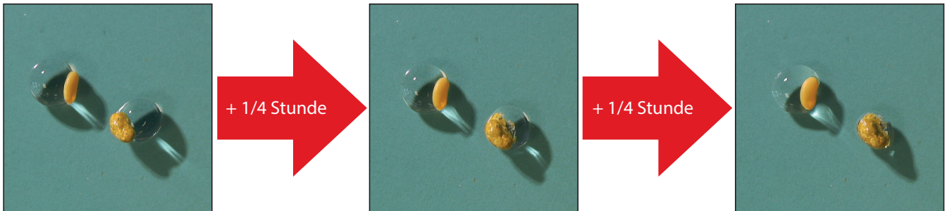
Abbildung 1: Verdunstung vs. Wasseraufnahme